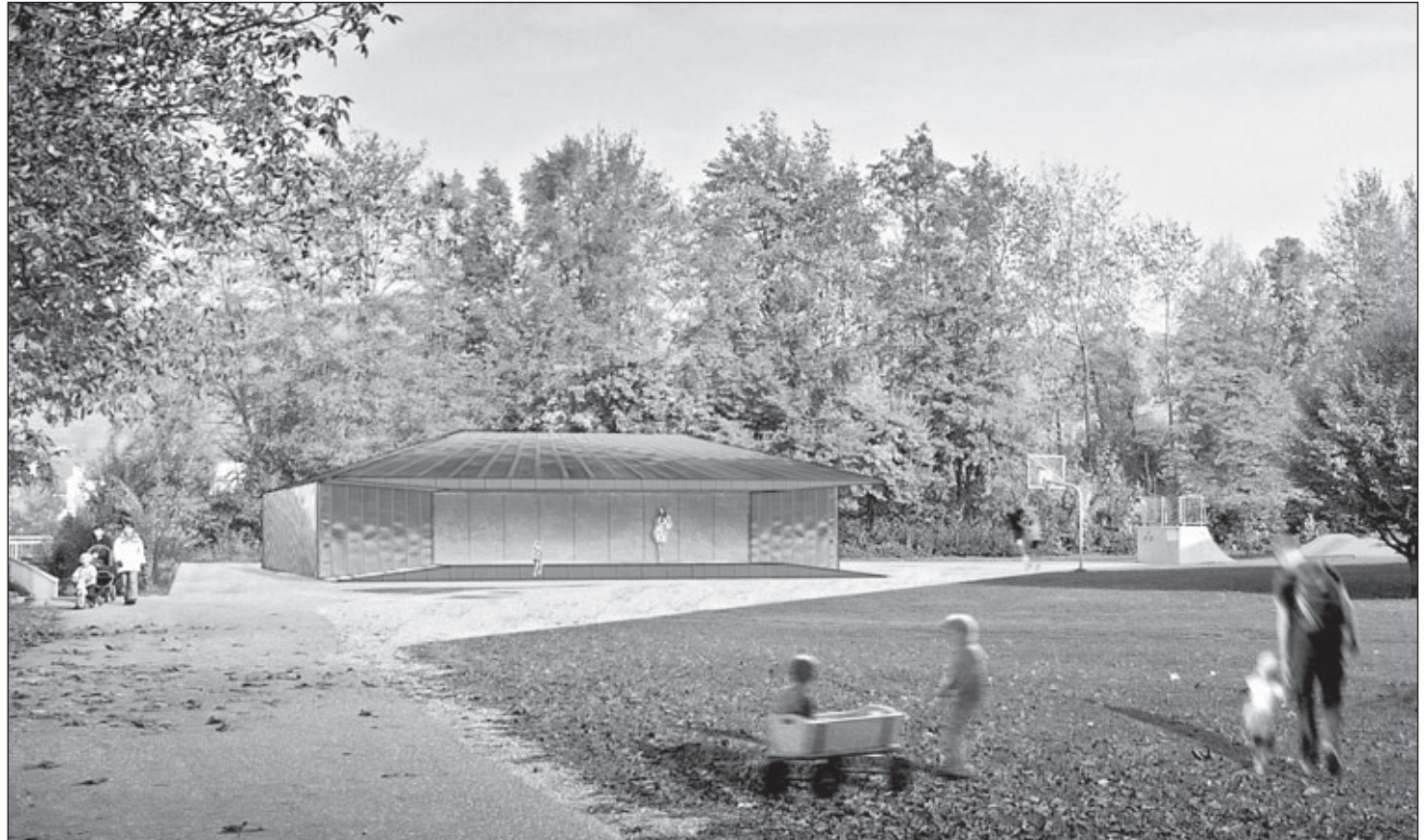
So könnte die Casa Musica neben der Schilfweg-Unterführung (links) einmal aussehen.

Derweil die eingeschossige Casa Musica noch im Stadium des Vorentwurfs steckt, war es Rainer Blessing für die notwendige Änderung des dortigen Bebauungsplans wichtig, das Parkplatz-Konzept festgezurrt zu wissen. Der Bauausschuss bekräftigte im Sitzungssaal, was sich vor Ort abgezeichnet hatte: In den Bebauungsplan soll die Variante mit den 26 Stellplätzen aufgenommen werden. Vom Tisch sind damit Überlegungen, Parkplätze entlang der Lerchenstraße (unter den Bäumen am Bolzplatz) anzulegen, bzw. auf die entfernter liegenden Park-